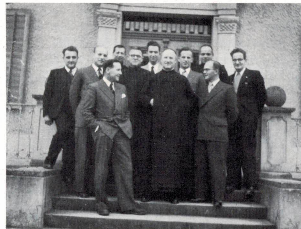
Die Diplomanden von 1939

Beim Mittagessen im Professorenheim konnten wir mit den ehemaligen Professoren zusammensitzen. P. Rektor unterstützte in seiner Tischrede das Bestreben der Handelsschüler, die Beziehungen der Ehemaligen zum